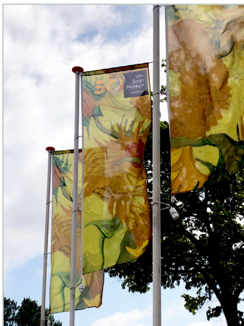
Museumplein 6 • 1071 DJ Amsterdam Dagelijks open van 09:00 tot 18:00 Het museum bestaat 50 jaar • het won een Licensing International Excellence Award in de categorie Best Brand – Art, Design, Museum tijdens de jaarlijkse Licensing Expo in Las Vegas op 12 juni 2023.

De redactie maakt jullie graag attent op de tentoonstelling die loopt in het Van Gogh Museum in Amsterdam tot en met 3 september 2023.