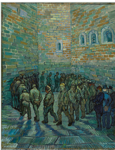
Het lichten van de gevangenen [naar Doré] Olieverf op doek • 80 x 64 cm Saint-Rémy • 10-11 februari 1890 Poesjkin Museum Moskou

Van alle schoonheid op aarde heeft Van Gogh er slechts één uitgekozen: de kleur. Altijd weer werd hij getroffen door de eigenschap van de natuur feilloos de kleuren te laten harmoniëren, door de ontelbare overgangen, door het palet van de aarde dat steeds verandert maar in alle jaargetijden en op alle breedtegraden altijd even mooi is.